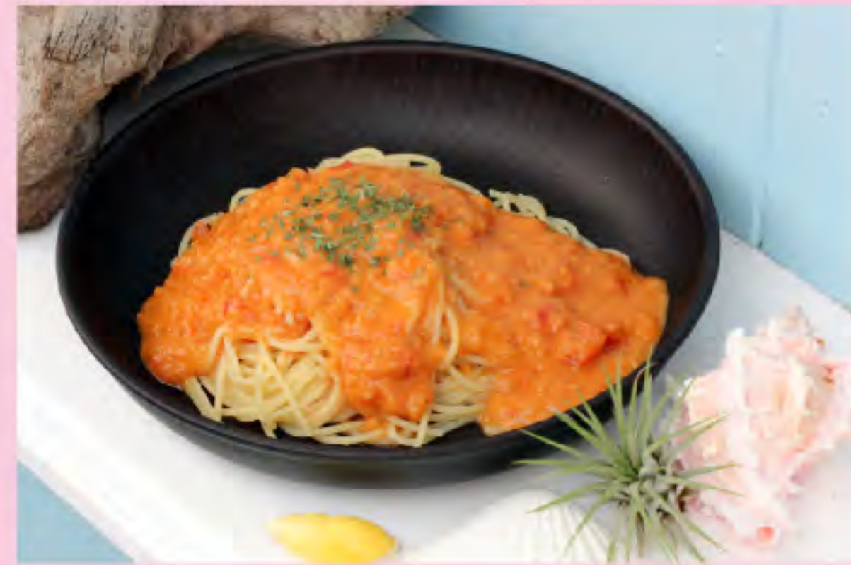
カニのトマトクリーム 700円