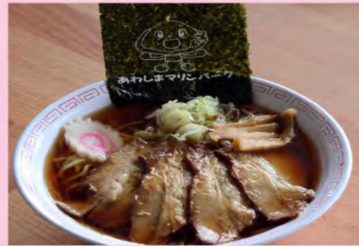
チャーシューメン 900円