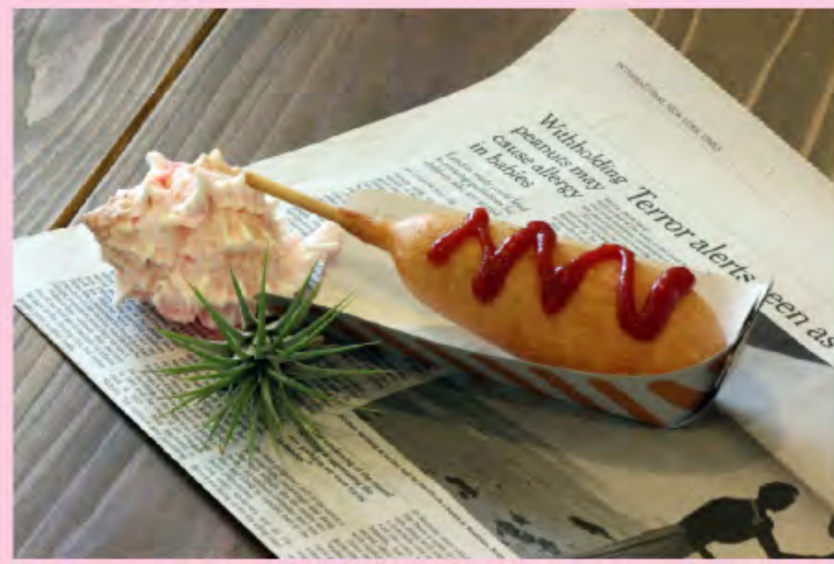
アメリカンドック 300円