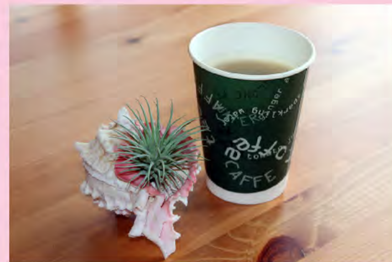
ハワイコナコーヒー 300円