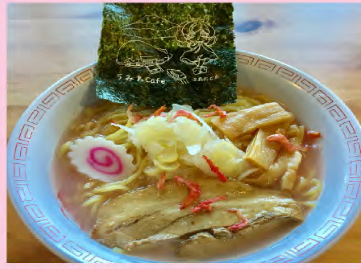
おとめラーメン (エビ醤油) 700円