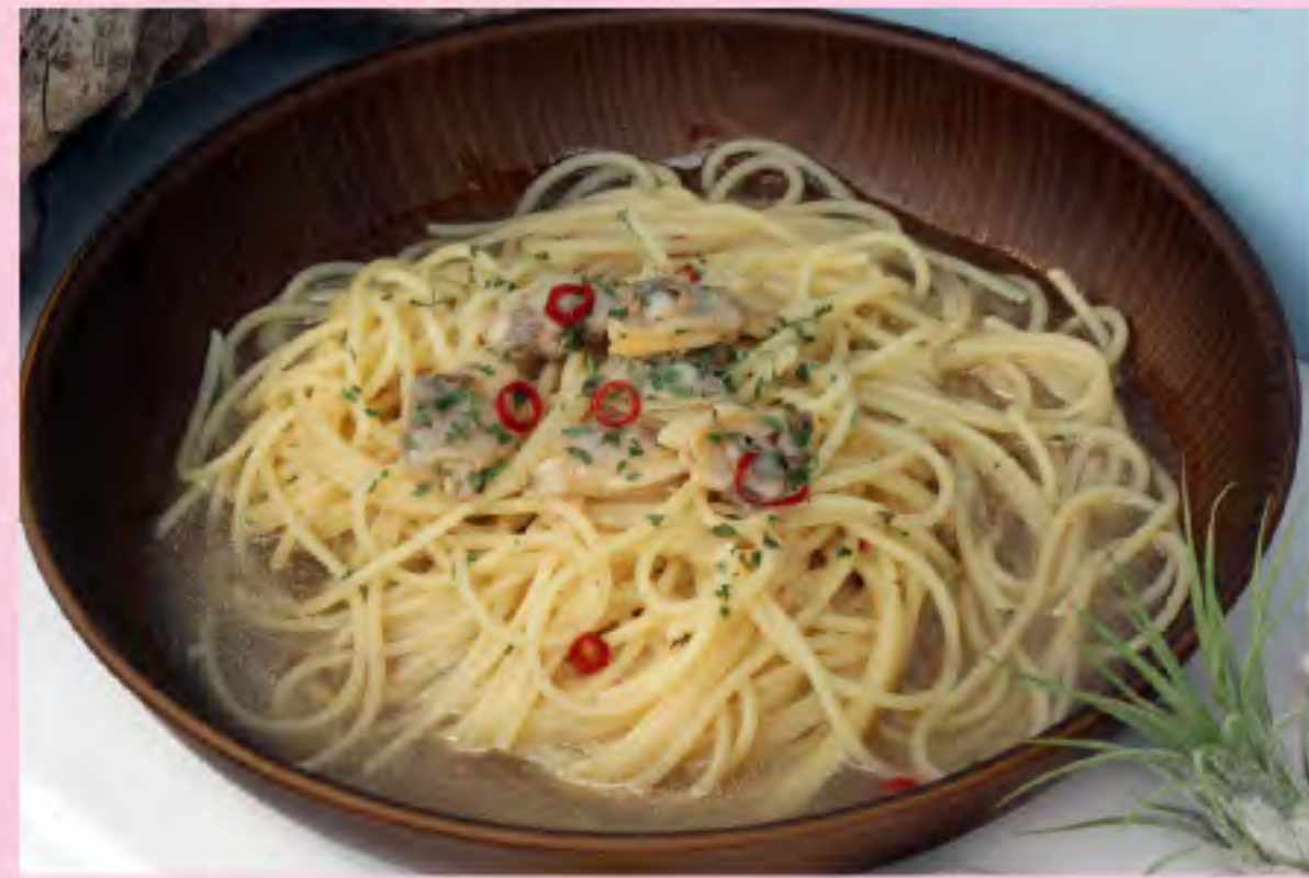
ボンゴレビアンコ 700円