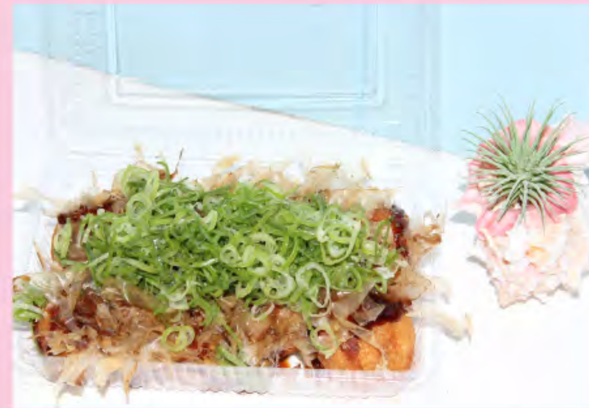
たこ焼き ソース (8個入) 550円