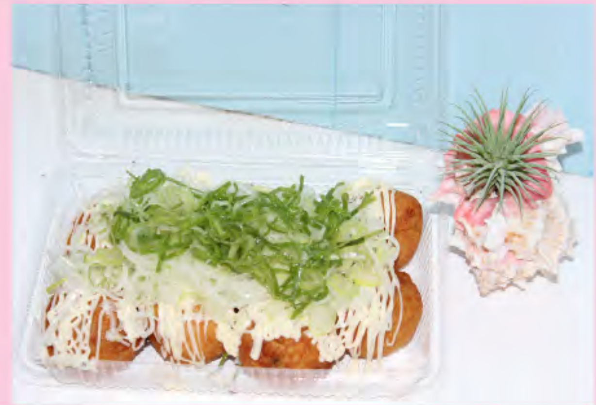
たこ焼き ネギ塩 (8個入) 550円