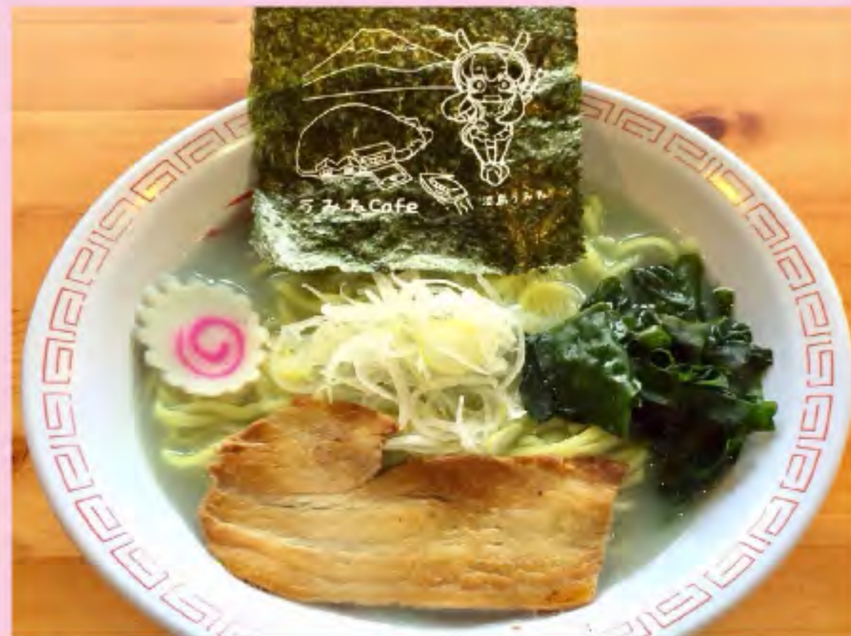
うみねラーメン (塩) 700円