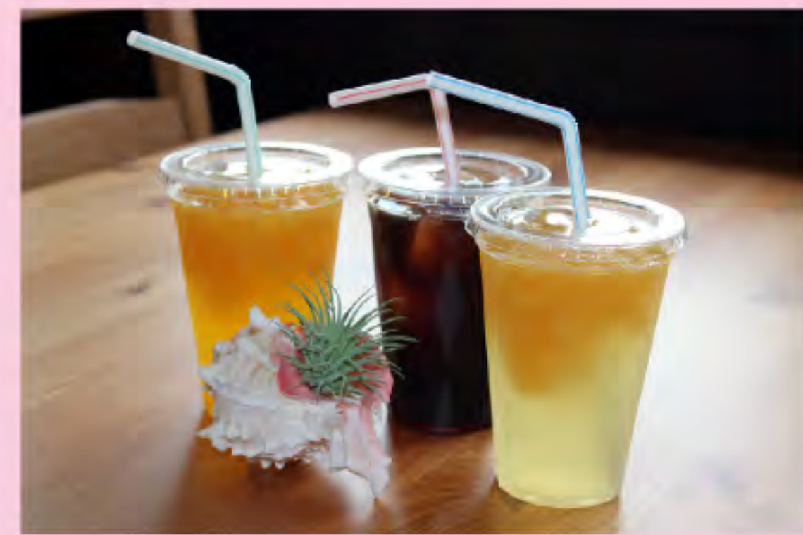
オレンジマンゴー アップルマンゴー アイスコーヒー アイスティー 各300円