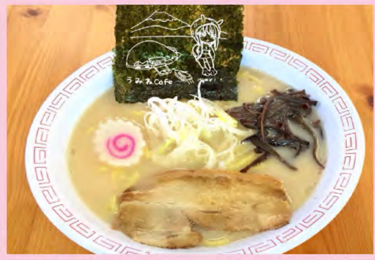
ましろラーメン (豚骨) 700円