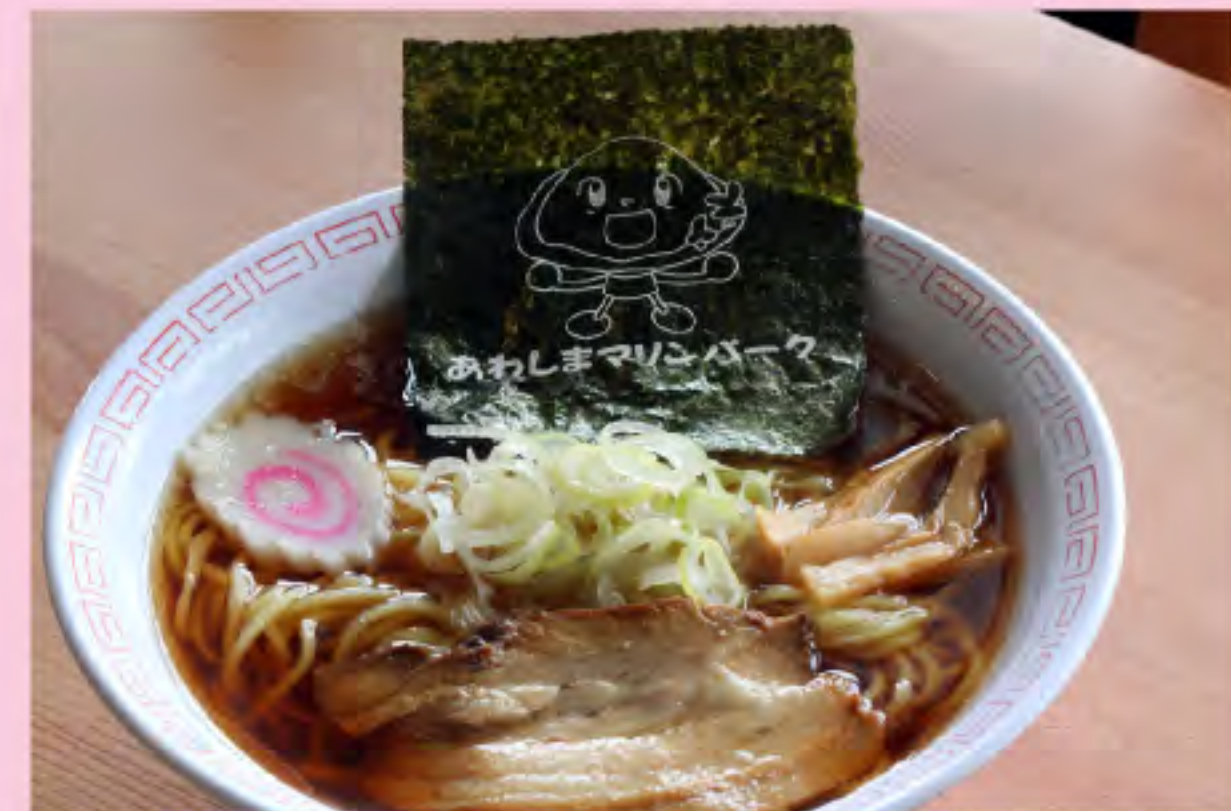
しまたろう ラーメン (醤油) 700円